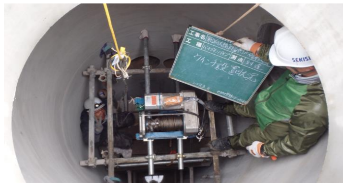
3.到達立坑(4号人孔)及びウインチ設置状況