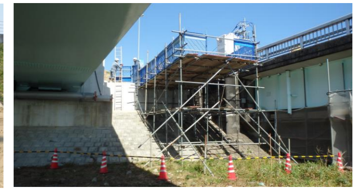
8.発進立坑施工ステージ②