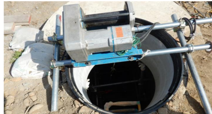
4.ウインチ設置状況2