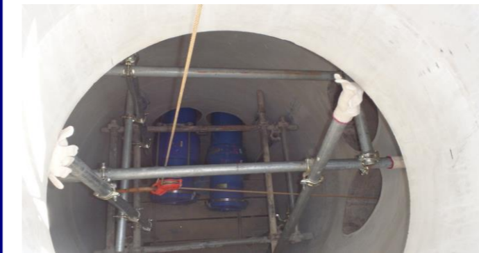
9.ウインチ引込状況