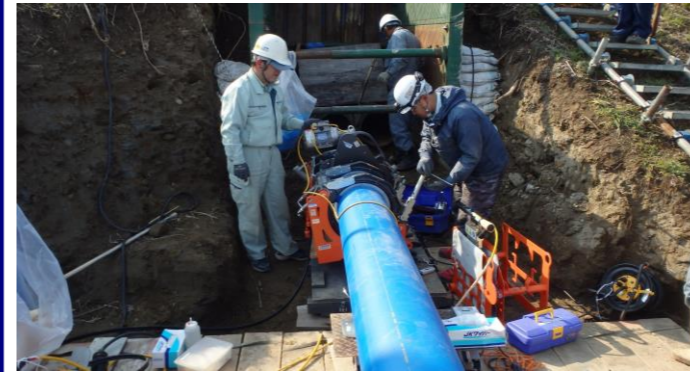
5.バット融着機設置状況1