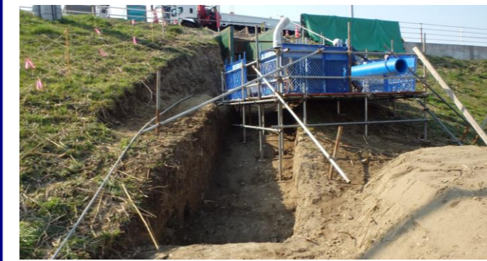
7.発進立坑施工ステージ①